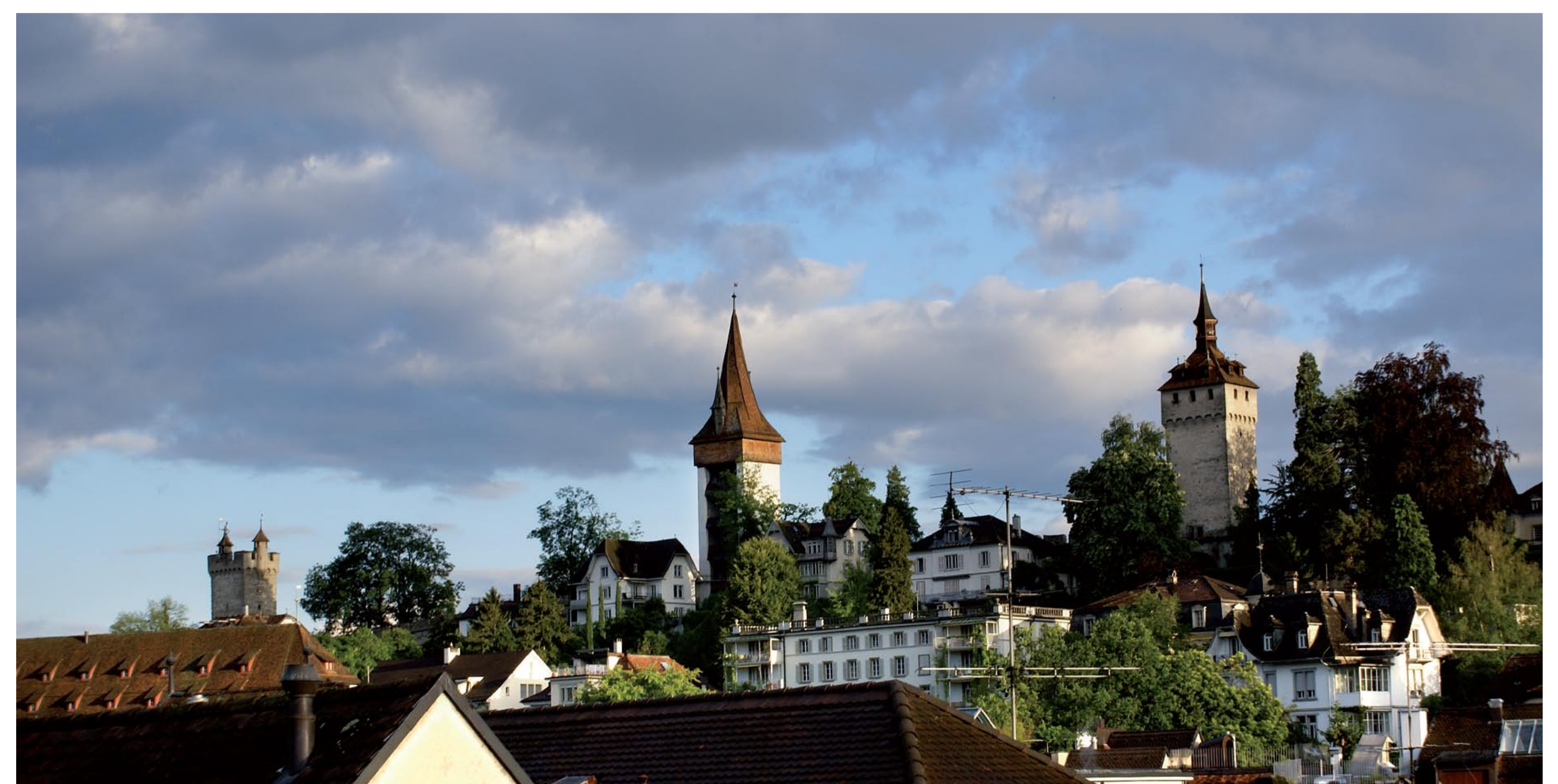
Blick von der Altstadt auf den Männli-turm, Luegislandturm und Wachturm.

Hinter der Zinnenkrone der Museggmauer zieht sich ein ungedeckter Wehgang hin. Die Zinnen erheben sich über einem nach aussen vorkragenden gemauerten, unregelmässigen Rundbogenfries mit eckigen und abgerundeten Konsolen. Die Mauer besitzt oder besass verschiedene Pforten. Aufschlussreiche Beobachtungen zur Baugeschichte gelangen im Bereich des Luegislandturms. An dieser Stelle war die Mauer gleichzeitig mit dem Turm bis auf eine Höhe von 3.5 m hochgezogen worden. Erst in einer zweiten Phase erhöhte man die Mauer auf rund 9 m.