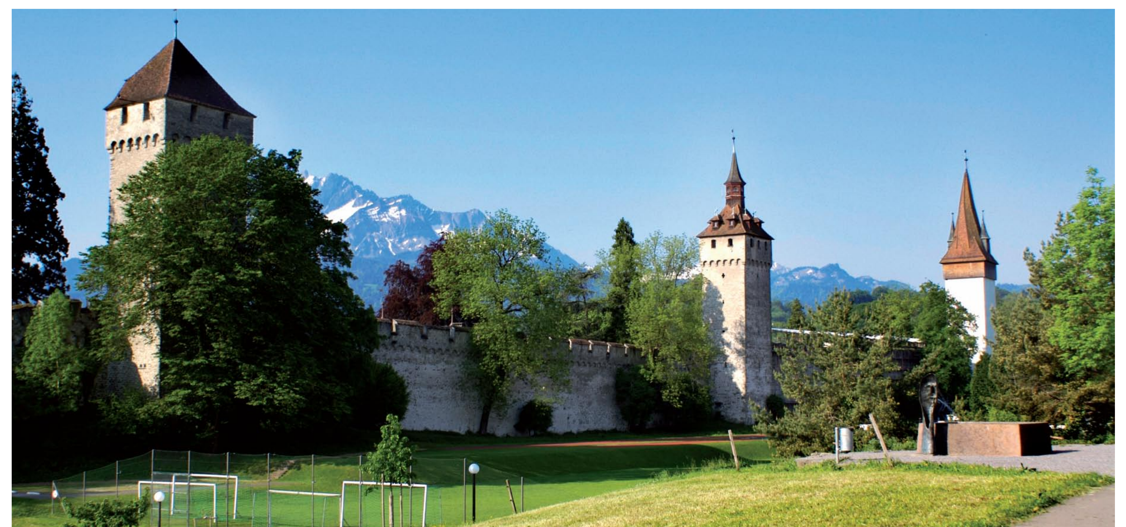
Blick von Norden (Bramberg) auf den Zytturm, Wachturm und Luegislandturm.